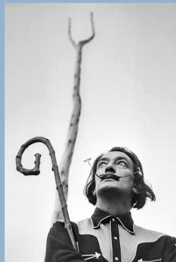
Jean Dieuzaide, reportage sur Salvador Dalí, Port Lligat, Cadaqués, 1953.