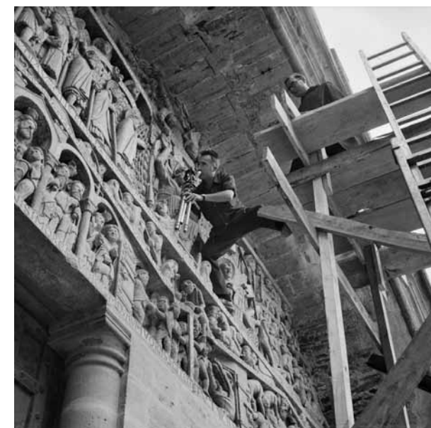
Auteur inconnu, Jean Dieuzaide sur le tympan de l'abbatiale de Conques 1960. Mairie de Toulouse, Archives municipales

Gratuit sur réservation à centenaire.dieuzaide@mairie-toulouse.fr